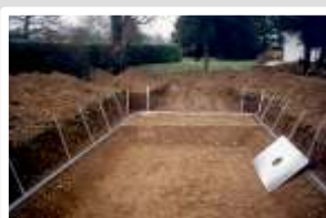
Terrassement - pose de la poutre inférieure Mise en place des raidisseurs.

LA QUALITE AU MEILLEUR PRIX Nécessite remblaiement en sable stabilisé