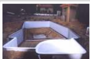
Pose des panneaux aluminium et de l'escalier