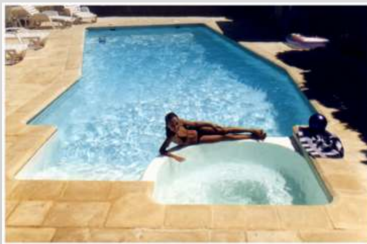
Pose des margelles et dallage. BONNE BAIGNADE...!