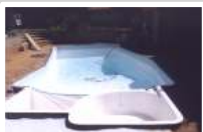
Mise en place du liner et remblaiement sable stabilisé