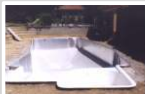
Réalisation du radier de fond