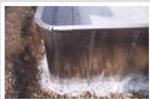
Détail angle système ALUSOFT